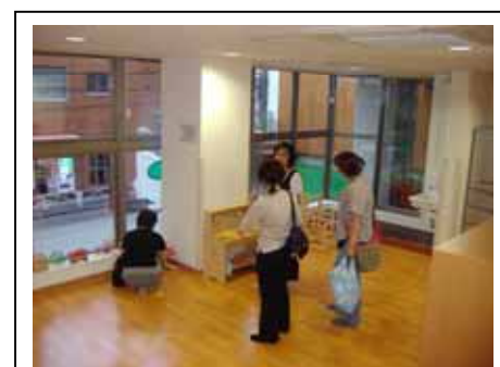
子育て広場ぶらんこ