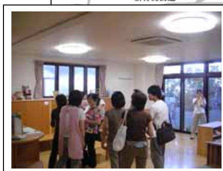
保育園ぼむを見学する参加者